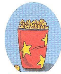
3. las palomitas