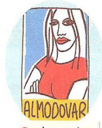
2. el cartel