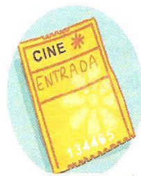
1. la entrada