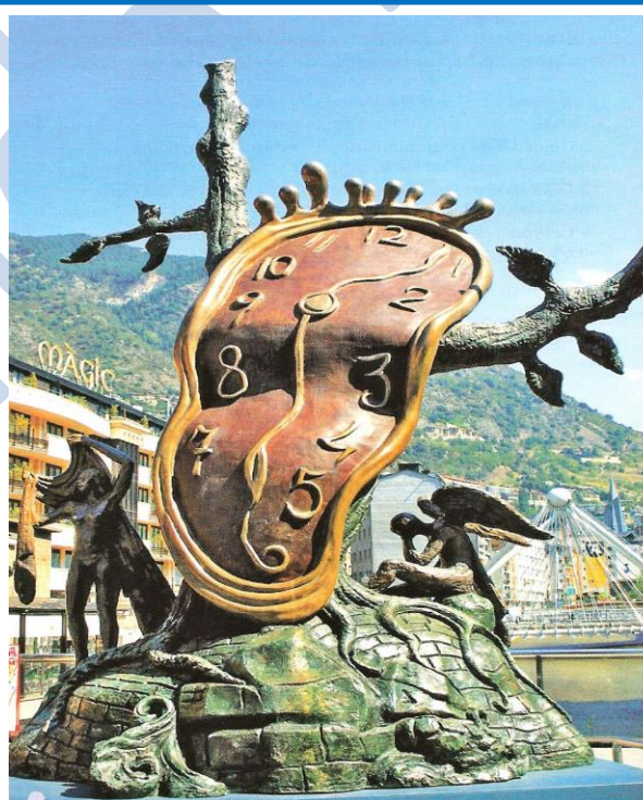
Salvador DALÍ, Nobleza de los tiempos (escultura de bronce en Andorra la Vella), 1984

A la izquierda , vemos a una persona y un ángel a la derecha .