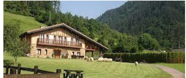
UN CASERÍO VASCO