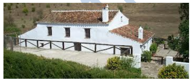
UN CORTIJO ANDALUZ