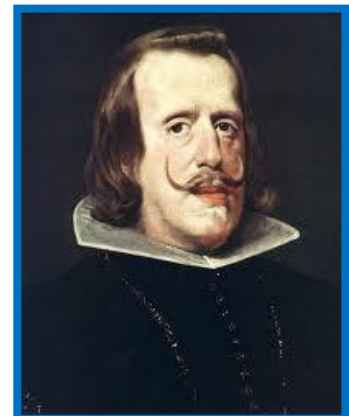
Felipe IV de Austria (1605-1665)