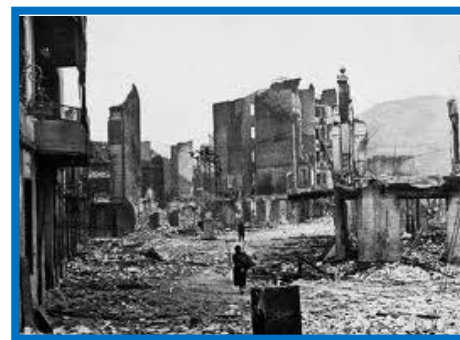
Los estragos del bombardeo en la ciudad de Guernica