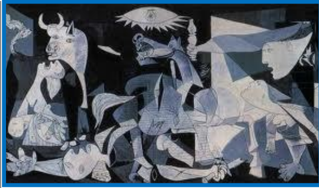
Guernica de Picasso / 1937 (349 x 777 cm)