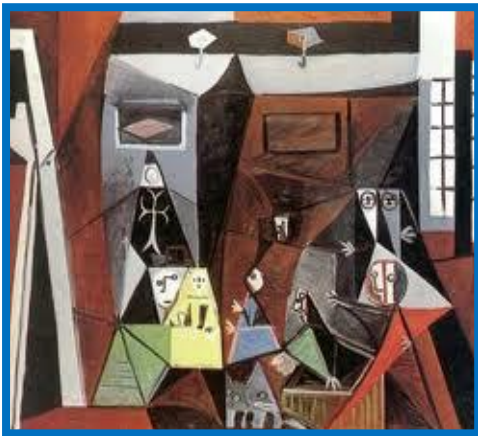
Las Meninas (1957) de Pablo Picasso.