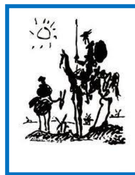
Don Quijote de la Mancha