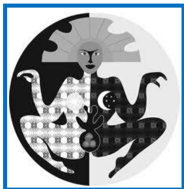
La Pachamama : divinidad de los indígenas.