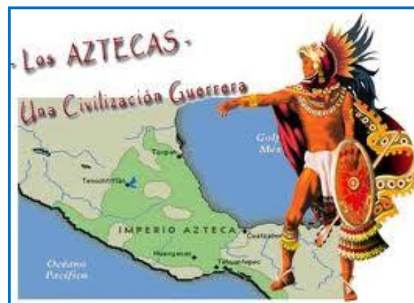
El territorio azteca

Asombrados, los españoles encontraron un país de organización teocrático-militar, con clases sociales muy marcadas : los nobles o aristocracia de sacerdotes-guerreros, los funcionarios y luego el pueblo trabajador. Pero la clase más interesante y que iba desarrollando un papel cada vez más importante era la de los comerciantes.