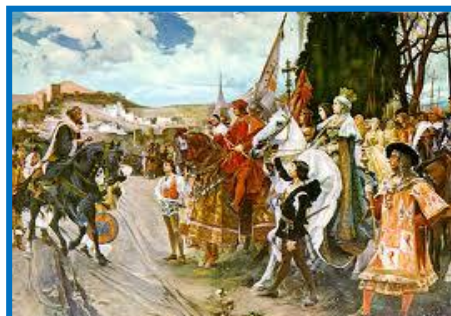
La rendición de Granada (1882)

Durante los dos siglos siguientes, el territorio dejado a los musulmanes por la reconquista irá reduciéndose como piel de zapa. Por fin, en 1492, la conquista de Granada por los Reyes Católicos marca la desaparición total del dominio árabe en la Península. Los ocho siglos de ocupación se caracterizan por el florecer de la civilización hispano-musulmana en lo de la economía, de las ciencias, de las artes.