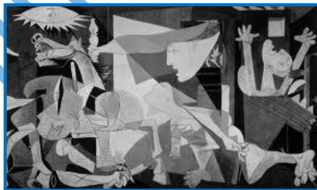
Pintado por el pintor malagueño entre los meses de mayo y junio de 1937

Un millón de muertos, 300.000 exiliados, decenas de ciudades arrasadas, el aparato económico destruido, la población dividida entre vencedores y vencidos, ese es el triste balance sobre el cual el general Franco va a establecer una dictadura que perdurará hasta su muerte en 1975.